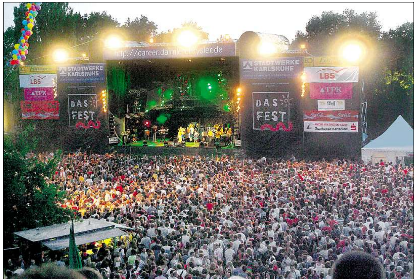
DIE FANS DES OPEN-AIR-SPEKTAKELS „Das Fest“ können aufatmen. Trotz des Streits im Stadtjugendausschuss über die Zukunft des beliebten Festivals in der Günther-Klotz-Anlage bleibt alles wie gehabt – das neue „Fest“ ist das alte.

Das Ergebnis: Bis zu 150 000 Euro Zuschuss für drei Jahre lautete die Antwort. Die „Fest“-Organisatoren wollen sich jedoch nach Kräf-